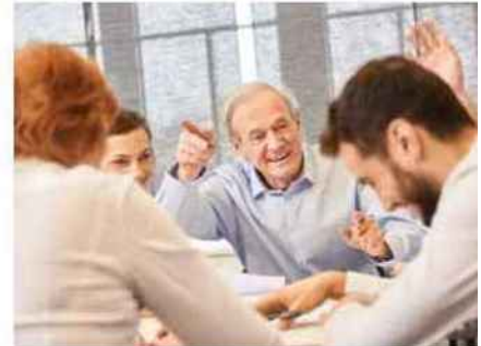
Ingénieurs et cadres à la retraite peuvent jouer un rôle précieux dans l'accompagnement des start-up.

celui du créateur, nombre de ces seniors initient des clubs et réseaux, des associations, avec une ambition, portée par leur investissement bénévole : s'appuyer sur un réseau de retraités pour transmettre leurs compétences et expériences professionnelles aux générations futures. C'est le cas de l'association nationale Entente des Générations pour l'Emploi et l'Entreprise (EGEE), fondée voilà près de 40 ans. Elle est présente dans toutes les régions et départements, forte de 1700 conseillers. La majorité a exercé au cours de leur carrière des responsabilités importantes dans les entreprises, l'enseignement ou le service public. Le 12 avril 2013, EGEE a été reconnue d'utilité publique. En Grand Est, elle est implantée à Colmar, Strasbourg, Mulhouse, Maxéville, Metz, Reims, Chaumont, Troyes, déclinant ses missions au plus près des territoires, tout particulièrement dans l'accompagnement aux porteurs de projets de création d'entreprise. Les béné-